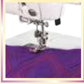
0.65 সে.মি. সীম ফুট